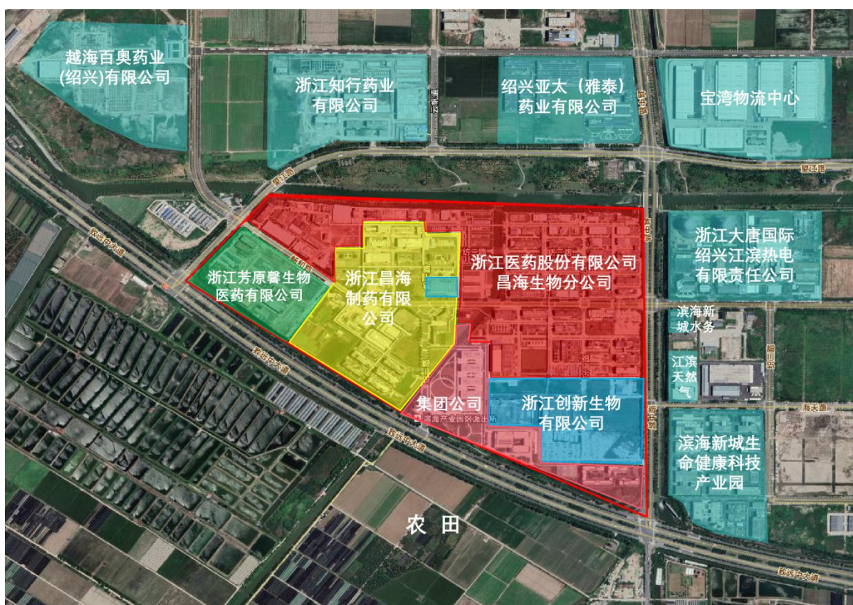
图 3.1-2 项目四邻关系示意图